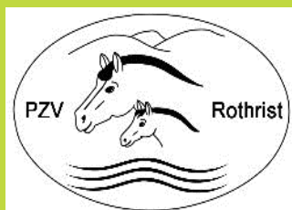
Pferdezuchtverein Rothrist und Umgebung www.pferdezuchtverein-rothrist.ch