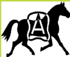
Pferdezuchtgenossenschaft Aargau www.freiberger-ag.ch