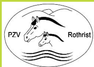
Pferdezuchtverein Rothrist und Umgebung www.pferdezuchtverein-rothrist.ch